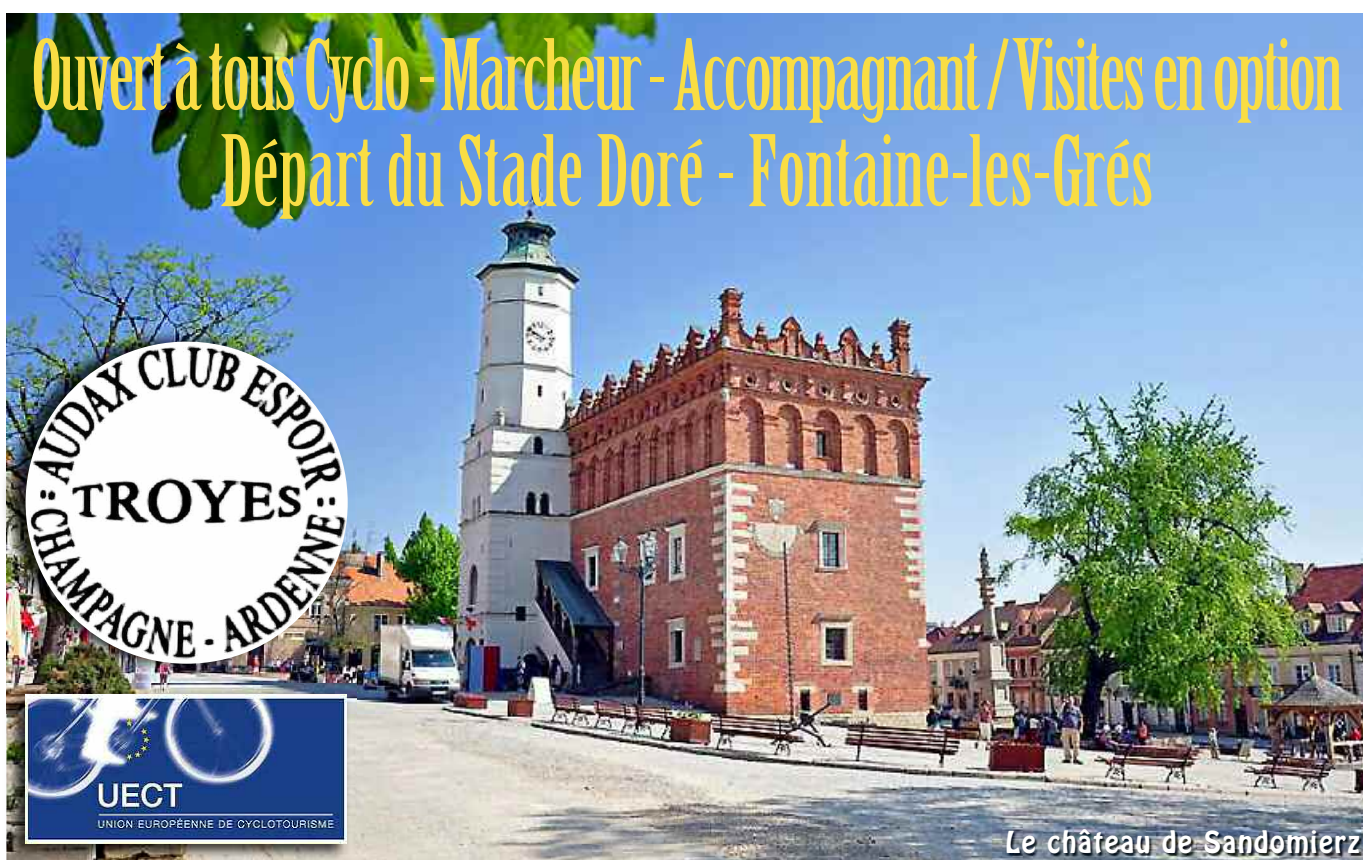
Le château de Sandomierz

Ouvert à tous Cyclo - Marcheur - Accompagnant / Visites en option Départ du Stade Doré - Fontaine-les-Grés